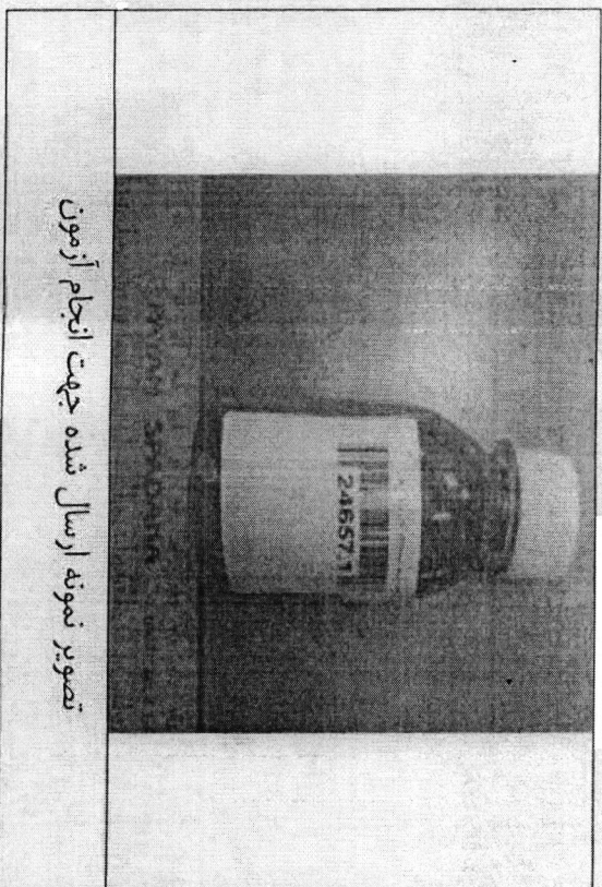
تصویر نمونه ارسال شده جهت انجام آزمون

گزارش تنها با پرچیب هوشمند مورد تایید است. مطابق نام نمونه یا قطعه ارسالی در حیطه مسئولیت این مرکز نیست. باقیمانده نمونه‌های مورد آزمون جداگانه به مدت یک ماه نگهداری خواهد شد.